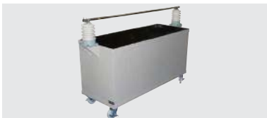
活線防具試験用水槽