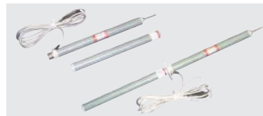
放電用抵抗付接地棒